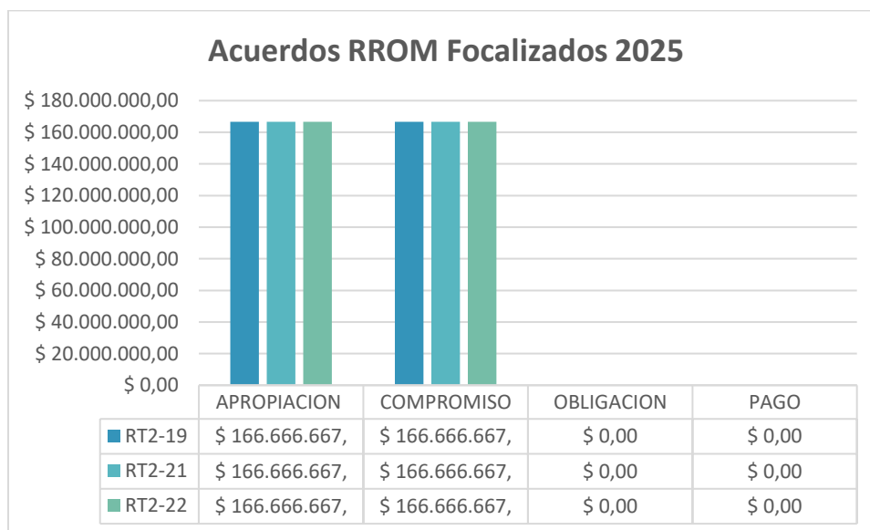
Gráfica 1. Avance presupuestal 2025 de los trazadores asignados a la Oficina de Promoción Social